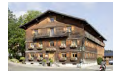
Generalsanierung Gasthof Adler