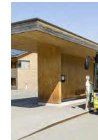
Neubau Bushaltstelle Dorf