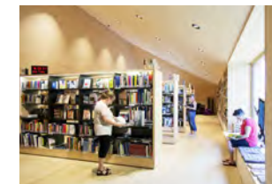
Neubau Pfarrhaus mit Kultursaal, Bücherei, Musikprobelokal, Pfarrräumlichkeiten