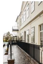
Entwicklung der Zone zwischen denkmalge- schütztem Möllerhof und Marienheim