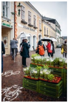
Umgestaltung der Hauptstraße