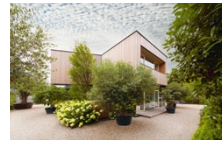
Neubau Bürohaus in Betriebsgebiet