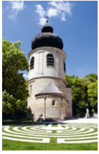
Umgestaltung Kirchenvorplatz St. Othmar