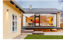
Sanierung eines privaten Vorstadthauses in einer Schutzzone