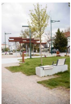
Gestaltung des „Fliegenspitz“ als Stadtteilplatz