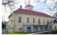
Sanierung des denkmalgeschützten Kindergartens „Litschauerhof“