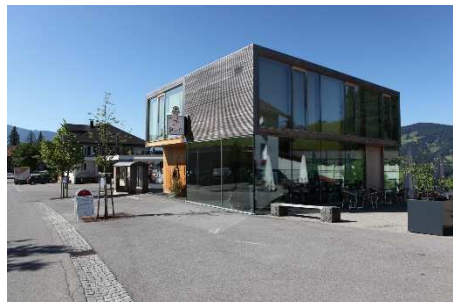
Das Café Stopp in Lauterach, Teil des Exkursionsprogramms im Oktober 2015.