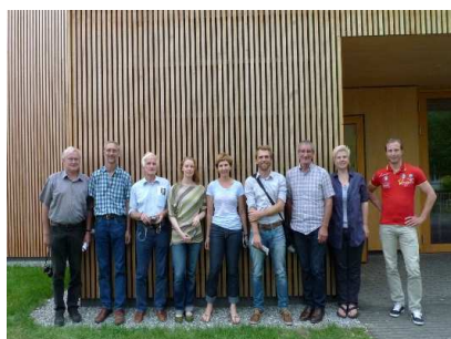
Gruppenfoto in Zwischenwasser, vor dem Kindergarten Muntlix (Akademie Juni 2014).