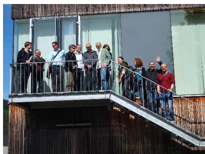
Gruppenfoto vor der Hörschule Hinterstoder (Akademie Mai 2015)