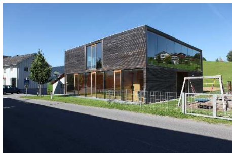
Der Kindergarten in Lauterach, Teil des Exkursionsprogramms im Oktober 2015.